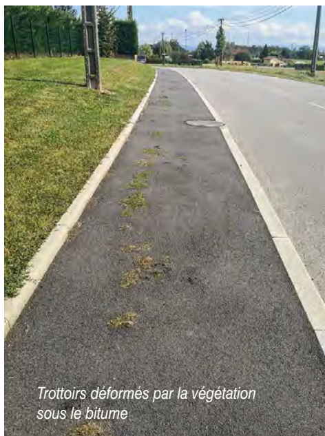
Trottoirs déformés par la végétation sous le bitume