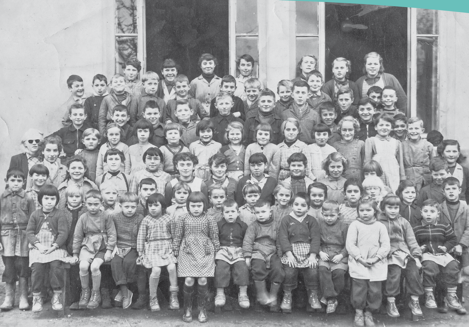
Ecole de Vandeins en 1955

A cette époque la « Caisse des écoles », devenue par la suite Sou des écoles, avait financé une nouvelle cuisinière à charbon pour la cantine et un téléviseur noir et blanc ce qui était un luxe pour l'époque. Les élèves franchissaient rarement les limites communales en excursion scolaire et la caisse des écoles avait peu de dépenses hormis les livres remis à chaque élève au certificat d'études primaires, un livre de cuisine pour les filles et un dictionnaire pour les garçons.